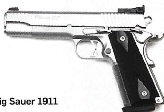
Sig Sauer 1911