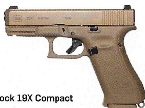
Glock 19X Compact