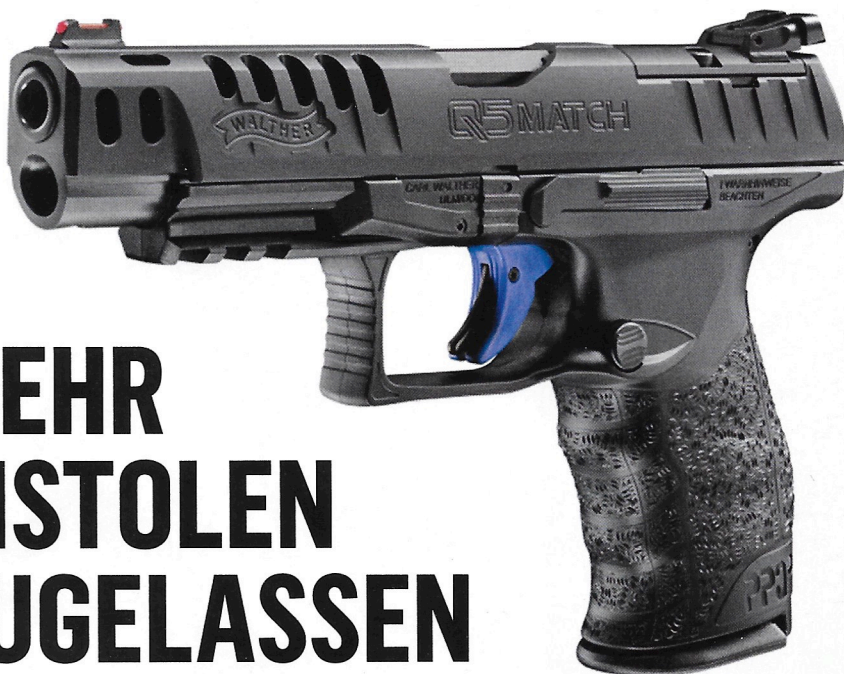
Walther Q5 Match Champion

Per 1. Januar 2022 trat das neue Hilfsmittelverzeichnis der Schweizer Armee in Kraft. Neu sind dank einer Vereinheitlichung der Zulassungskriterien DEUTLICH MEHR PISTOLEN zu den Bundesübungen und somit auch an SSV-Wettkämpfen zugelassen.